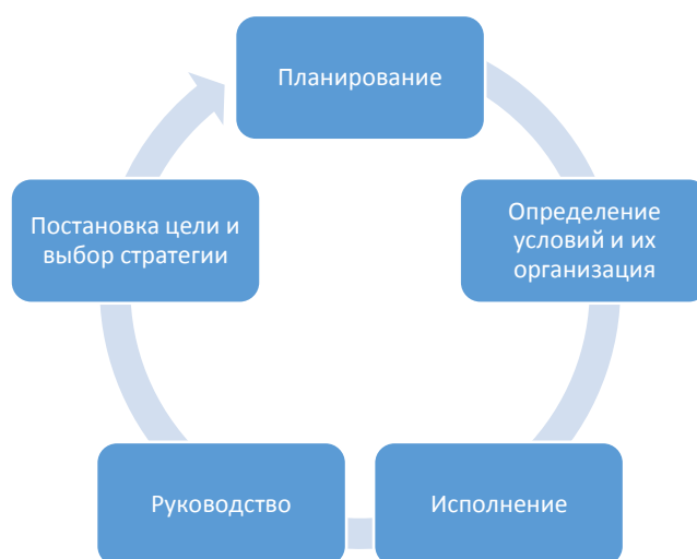
Рис.1 Схема менеджмента

Построение СМК для руководителя СЭО можно изобразить схематически, где на каждом этапе цикла решаются соответствующие задачи» 179 (см. рис.1).