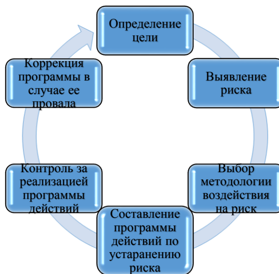
Рис. 3 Процесс управления риском

Процесс управления риском направлен на организацию системы мер, направленных на рациональное совмещение всех его элементов в единую технологическую операцию, как показано на рис. 3.