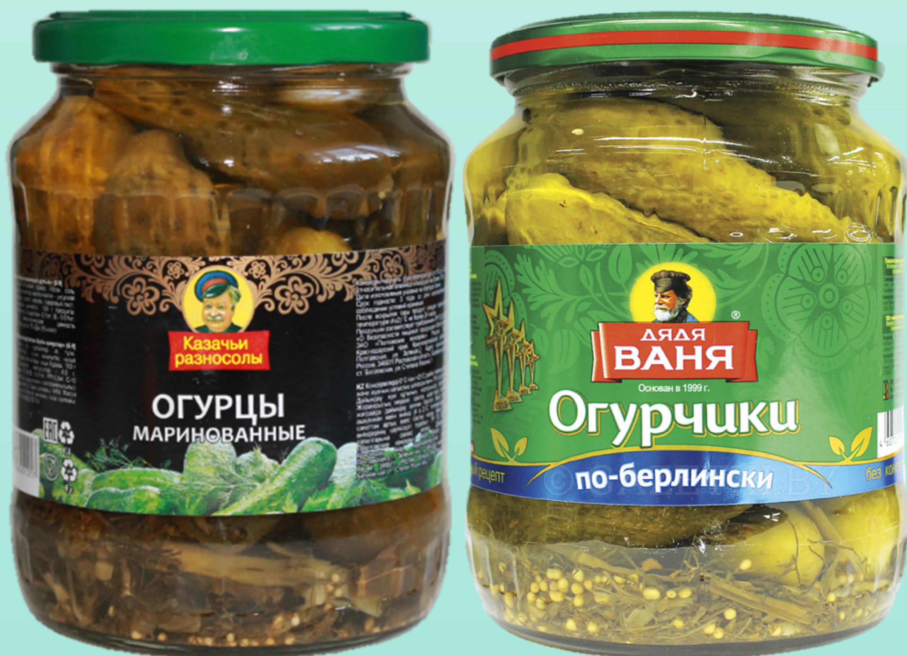
Могут ли респонденты (20-23 года) спутать товары в магазине?